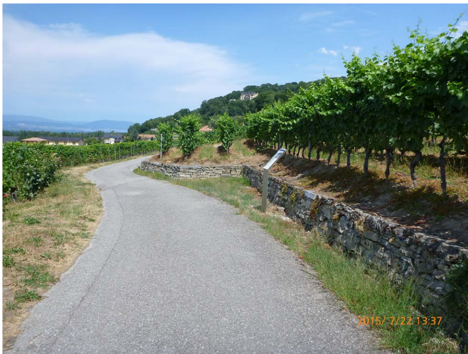
Photos de l'objet 22.07.2015